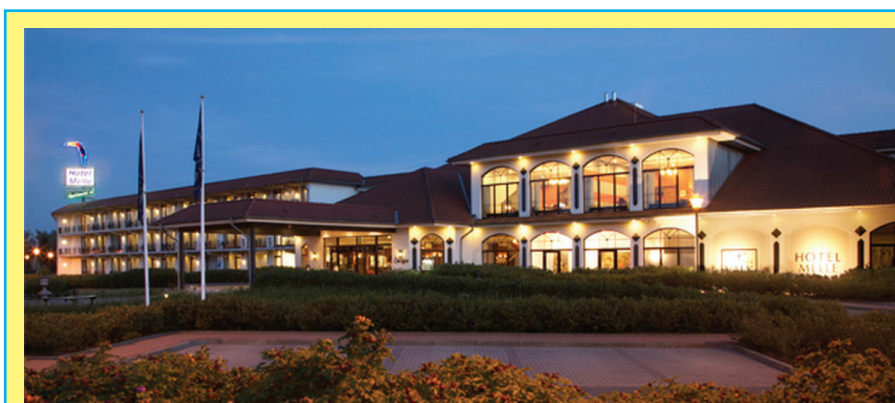
Van der Valk Hotel Melle